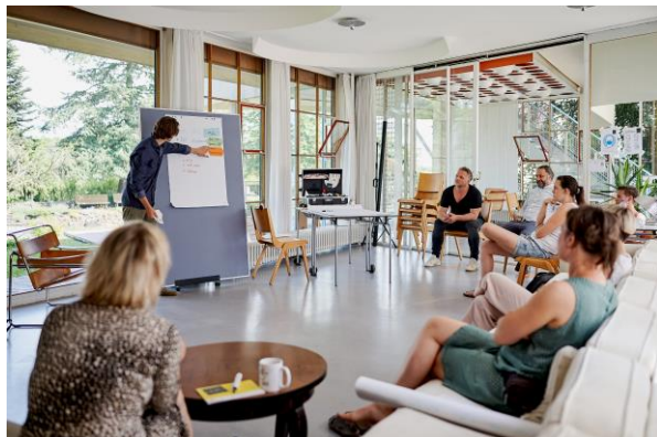
StartupCamp Lausitz – Löbau (Juni 2021): Workshop

aufgrund eines Beschlusses des Deutschen Bundestages