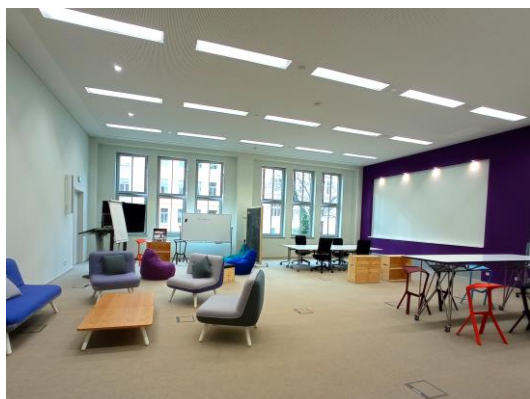
CoWorking Space ENERGY @ Siemens Inno- vationscampus Görlitz