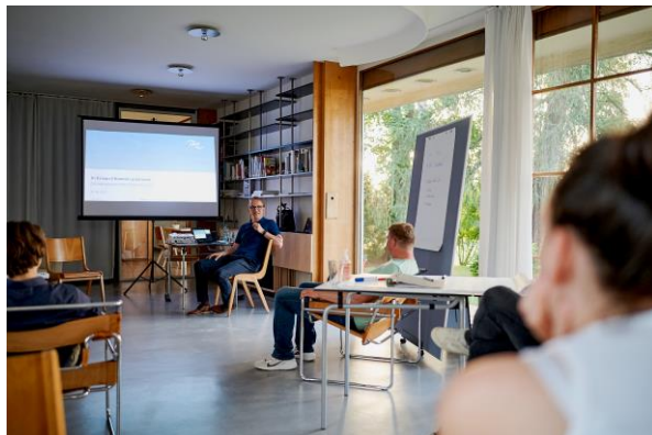
StartupCamp Lausitz – Löbau (Juni 2021): Unter- nehmer-Gesprächsabend (A. Jakschik – ULT AG)